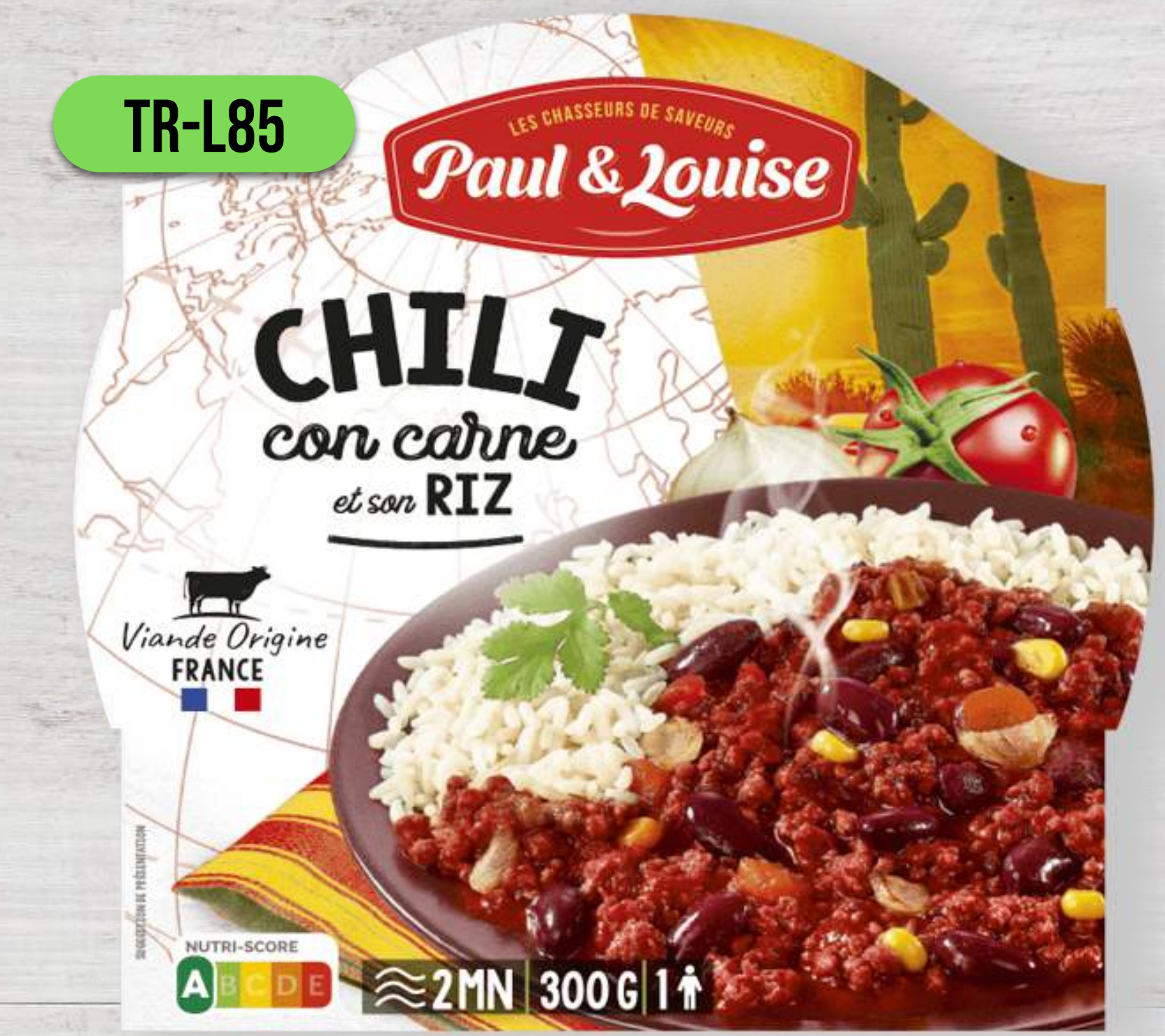
CHILLI CON CARNE S RYŽOU