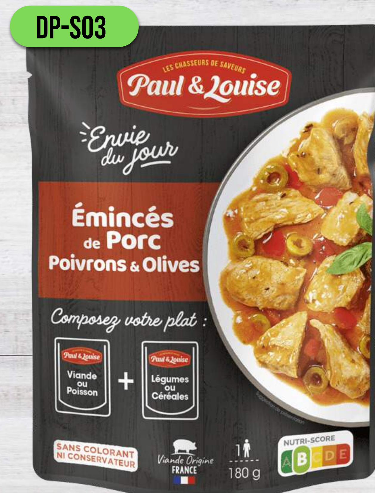
BRÁVČOVÉ S ČIERNYM KORENÍM A OLIVAMI