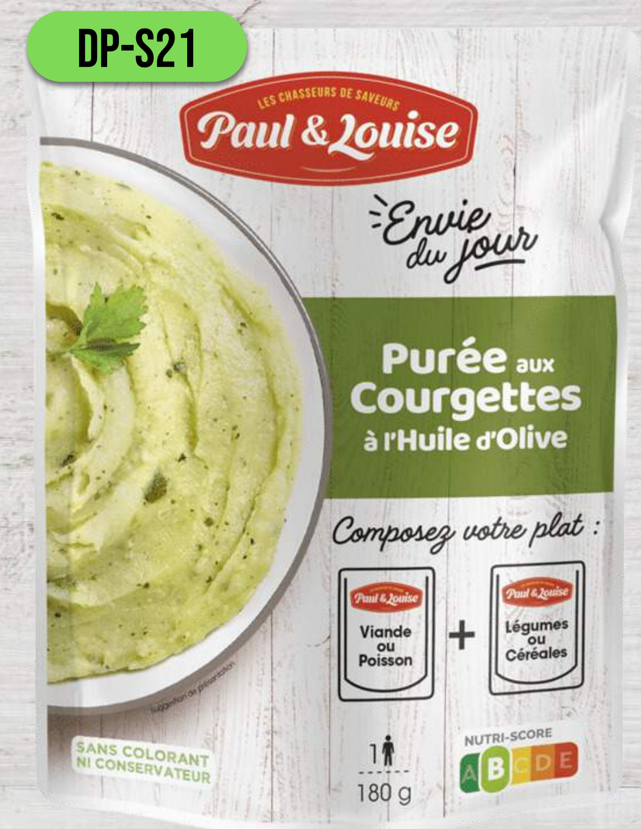
CUKETOVÉ PYRÉ NA OLIVOVOM OLEJI