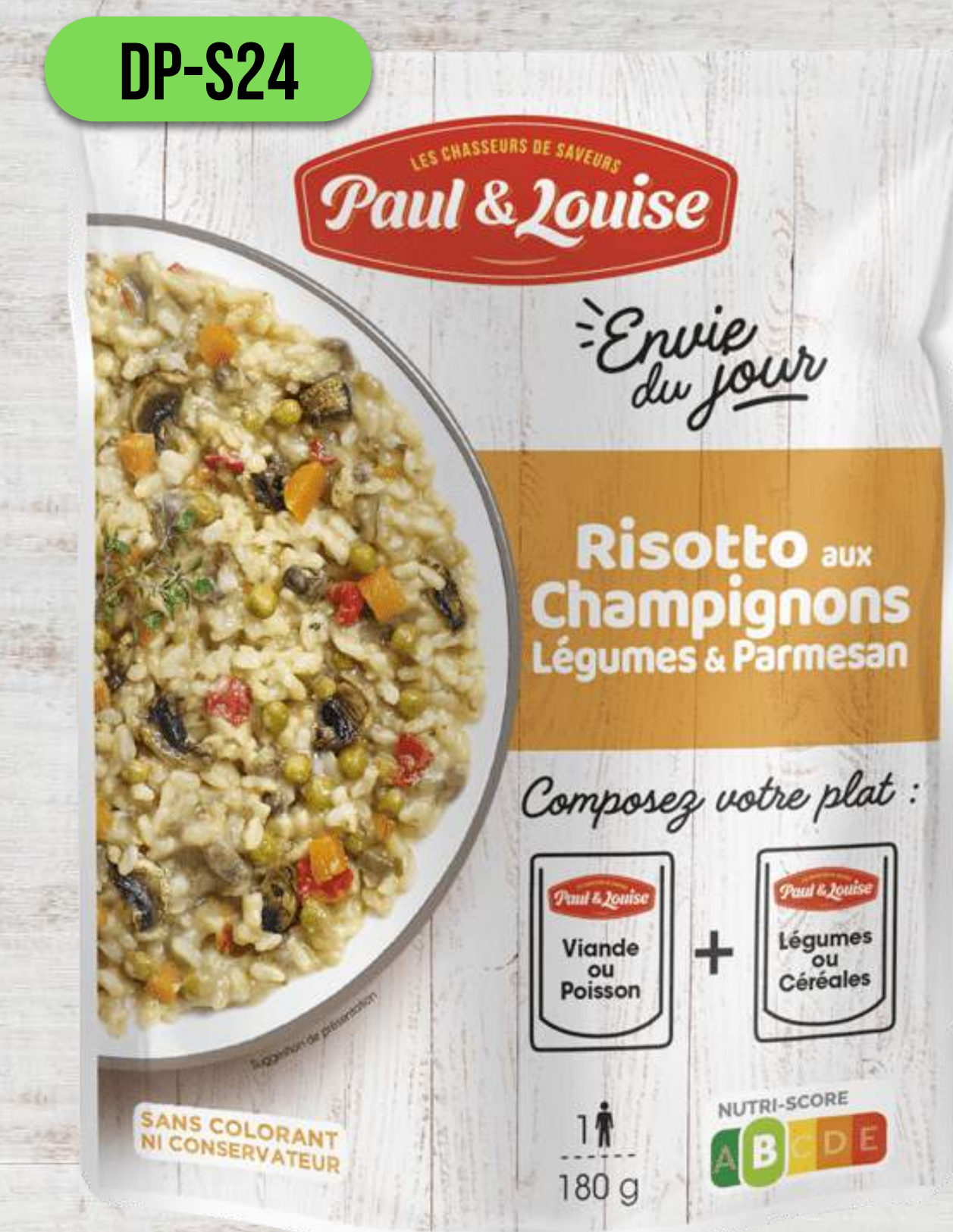
RIZOTO S HUBAMI, ZELENINOU A PARMEZÁNOM