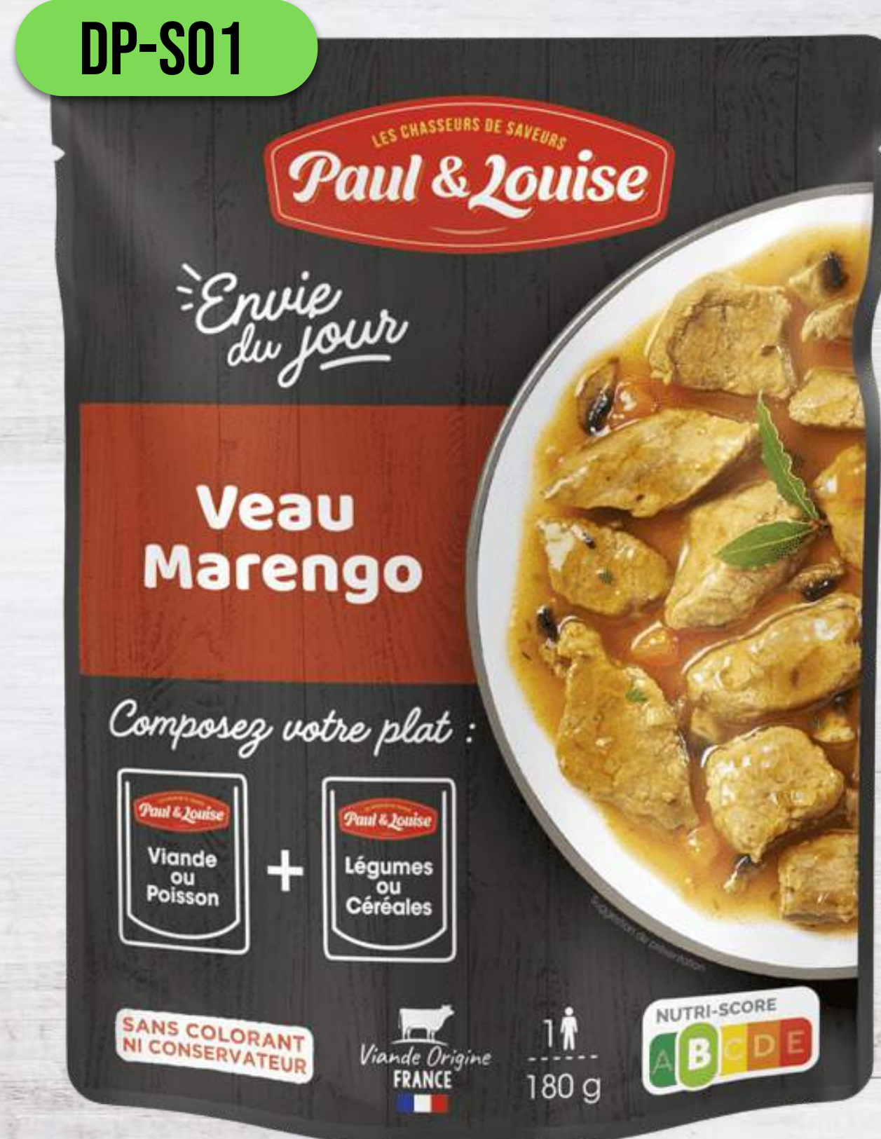
TEĽACIE S HRÍBIKMI A ZELENINOU NA SPÔSOB MARENGO