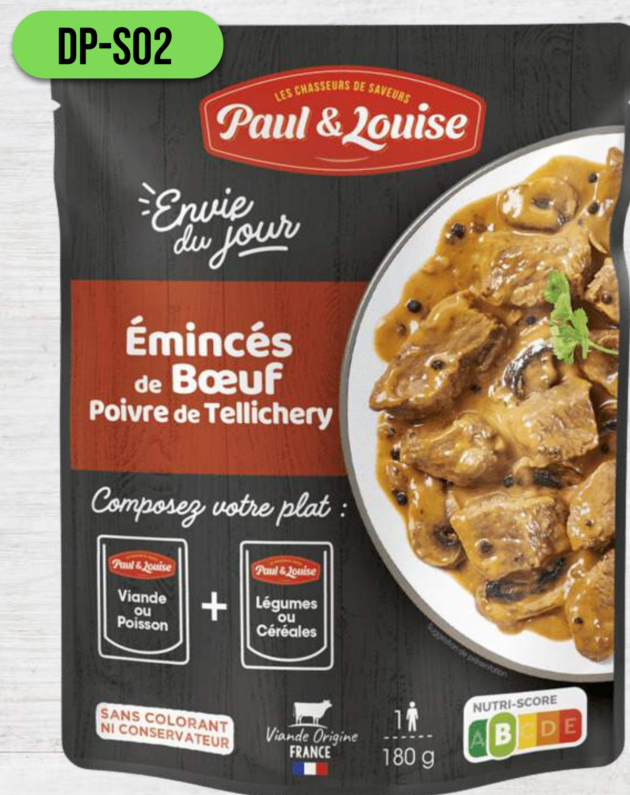
HOVÄDZIE S HUBAMI A ČIERNYM KORENÍM TELlichERY

DOYPACK VRECKÁ 180G + 180G DO MIKROVLNKY AJ DO HRNCA