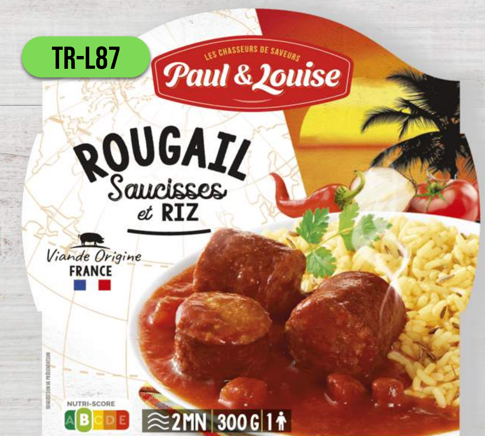
ÚDENÉ KLOBÁŠKY ROUGAIL S RYŽOU