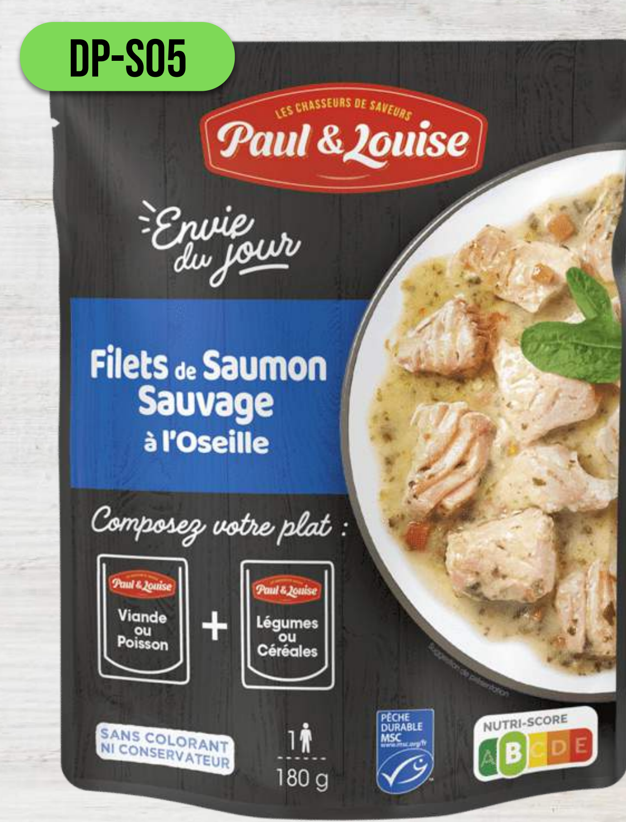
FILET Z DIVOKÉHO LOSOSA SO ŠTAVEĽOM