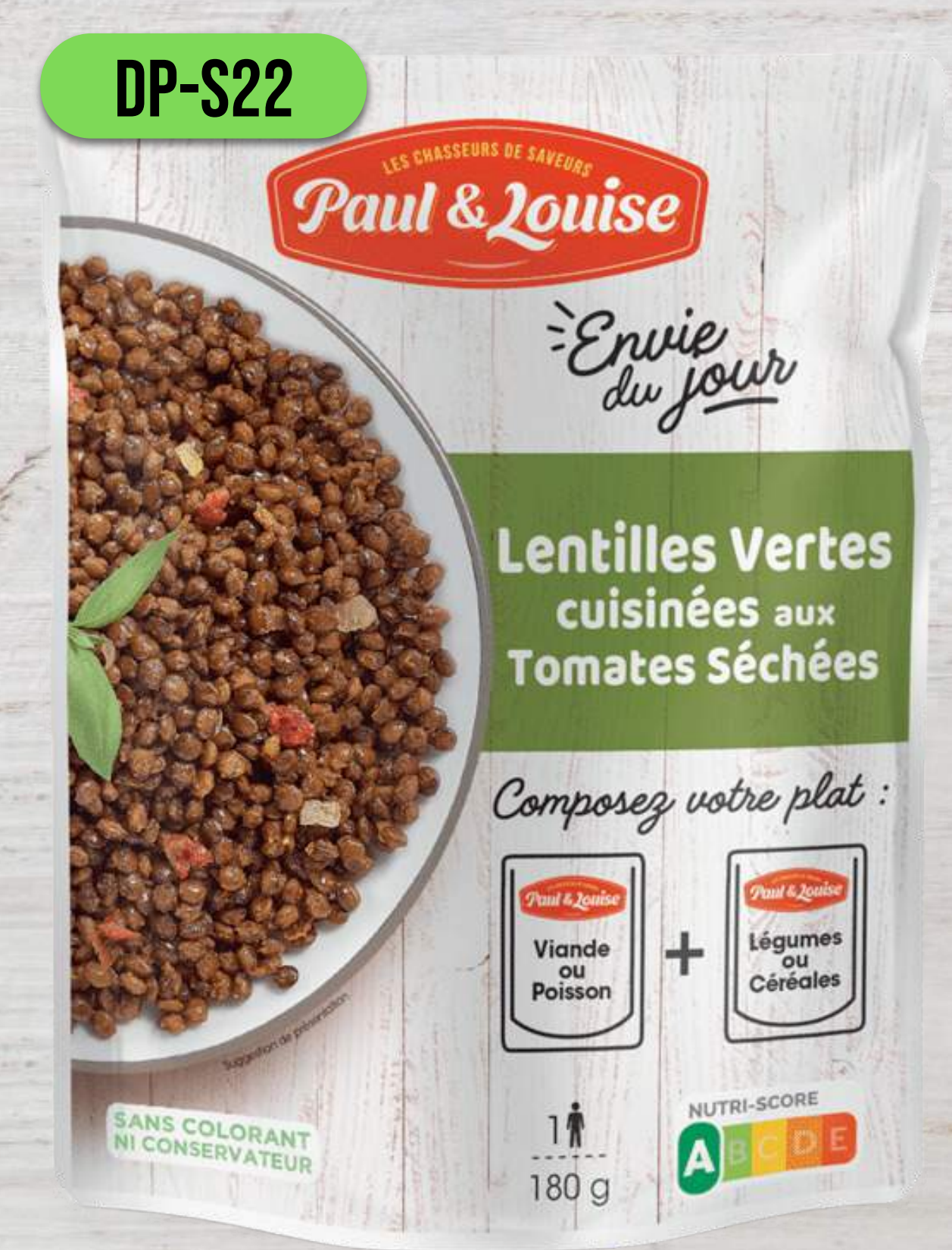
ZELENÁ ŠOŠOVICA SO SUŠENÝMI PARADAJKAMI