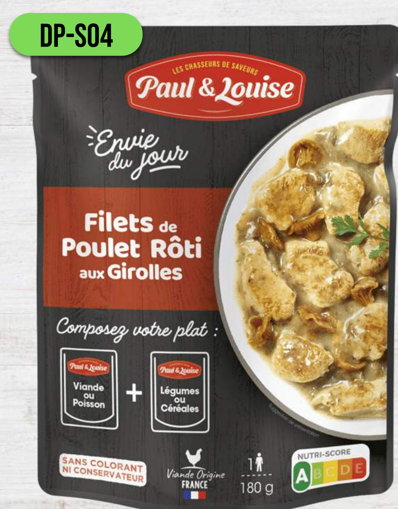
GRILOVANÉ KURACIE FILETY S KURIATKAMI