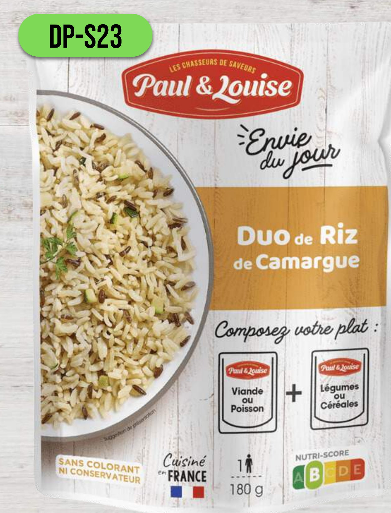
DUO RYŽE Z CAMARGUE