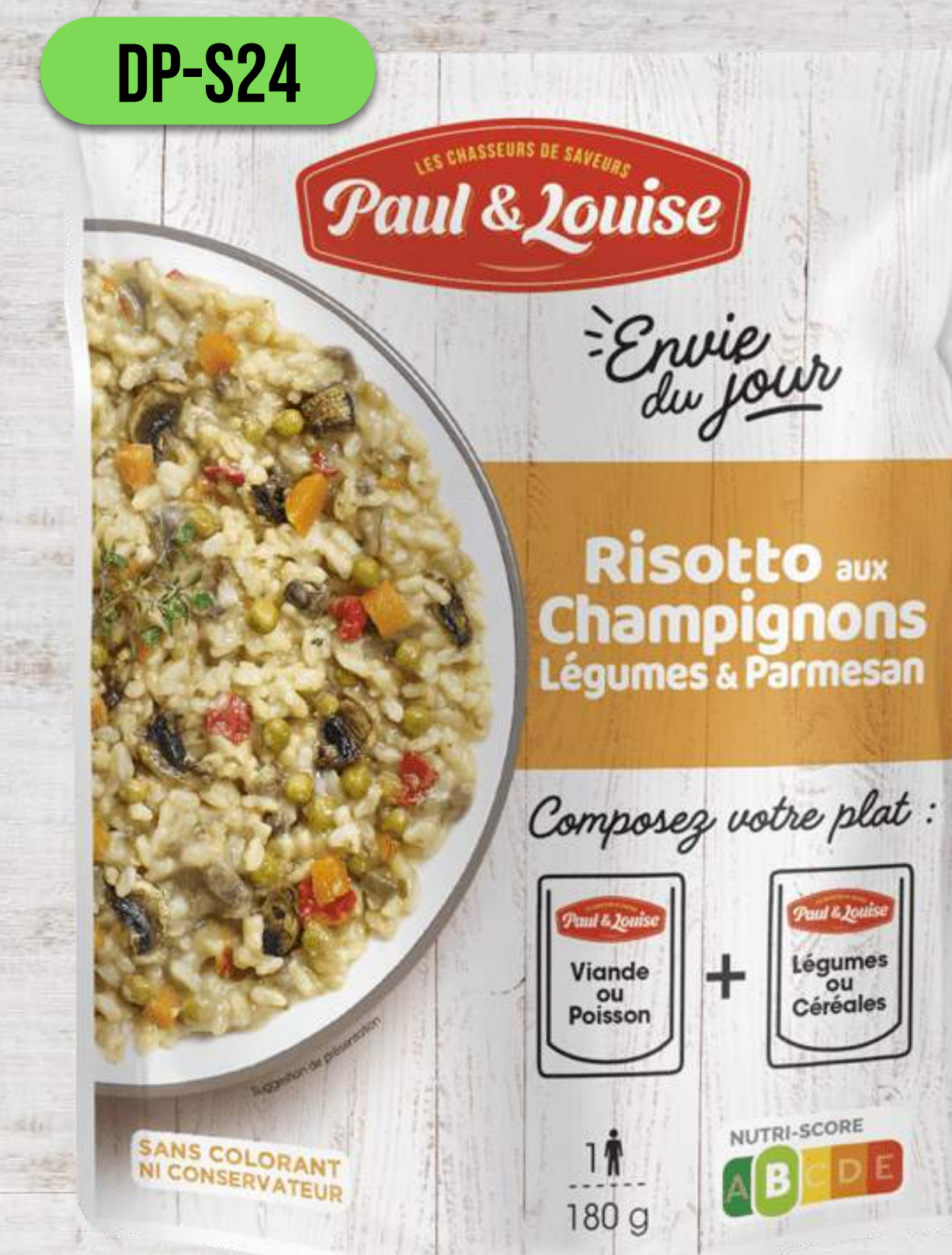
RIZOTO S HUBAMI, ZELENINOU A PARMEZÁNOM