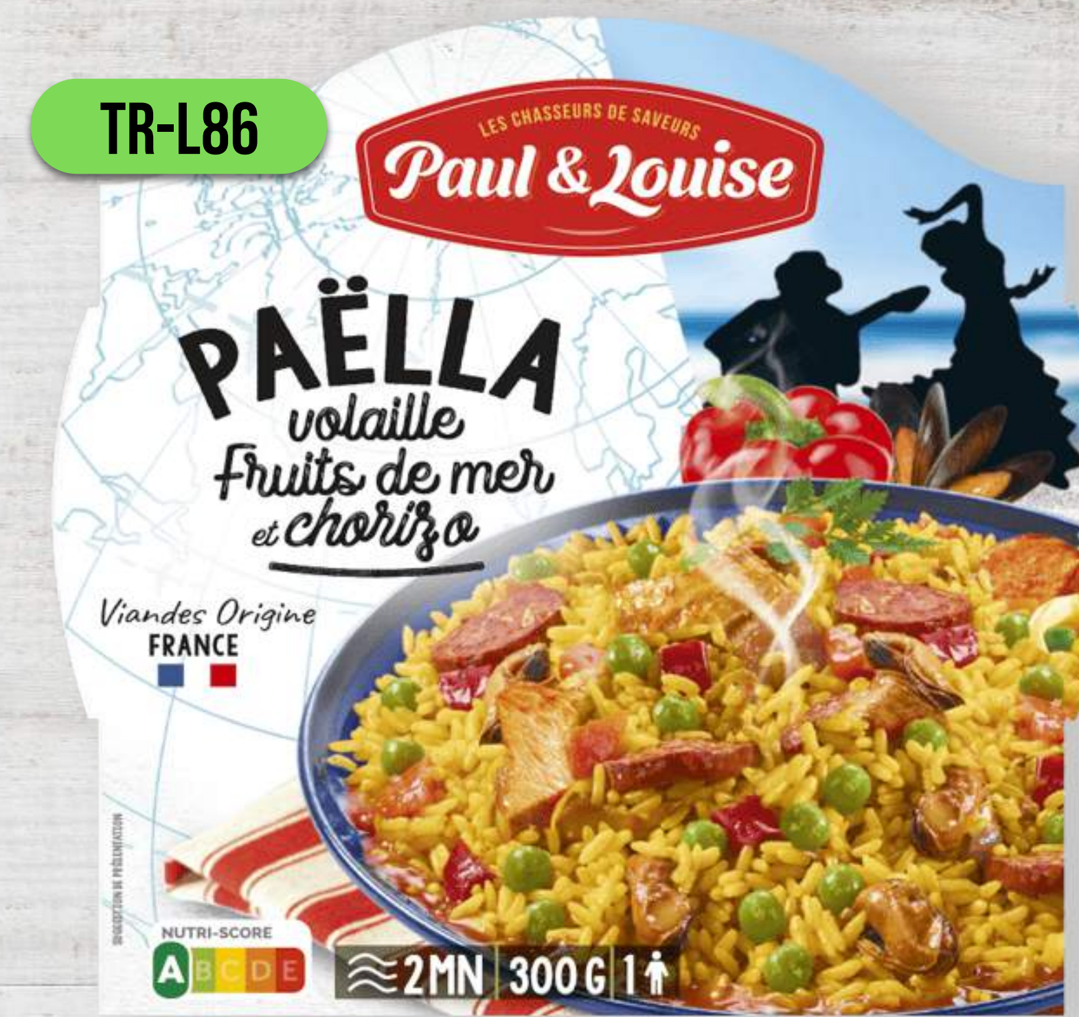
PAELLA S KURACÍM MÄSOM, PLODMI MORA A CHORIZOM