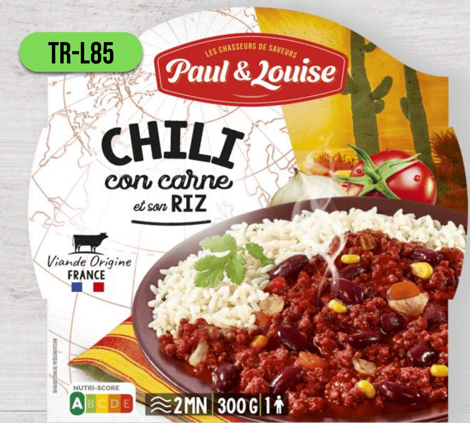
CHILLI CON CARNE S RYŽOU