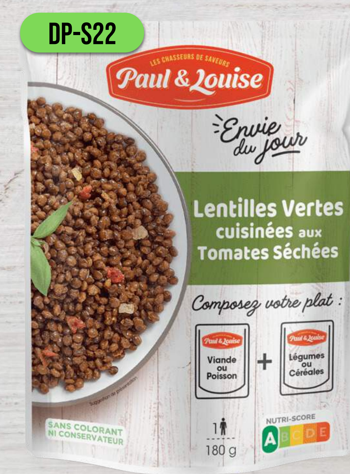
ZELENÁ ŠOŠOVICA SO SUŠENÝMI PARADAJKAMI