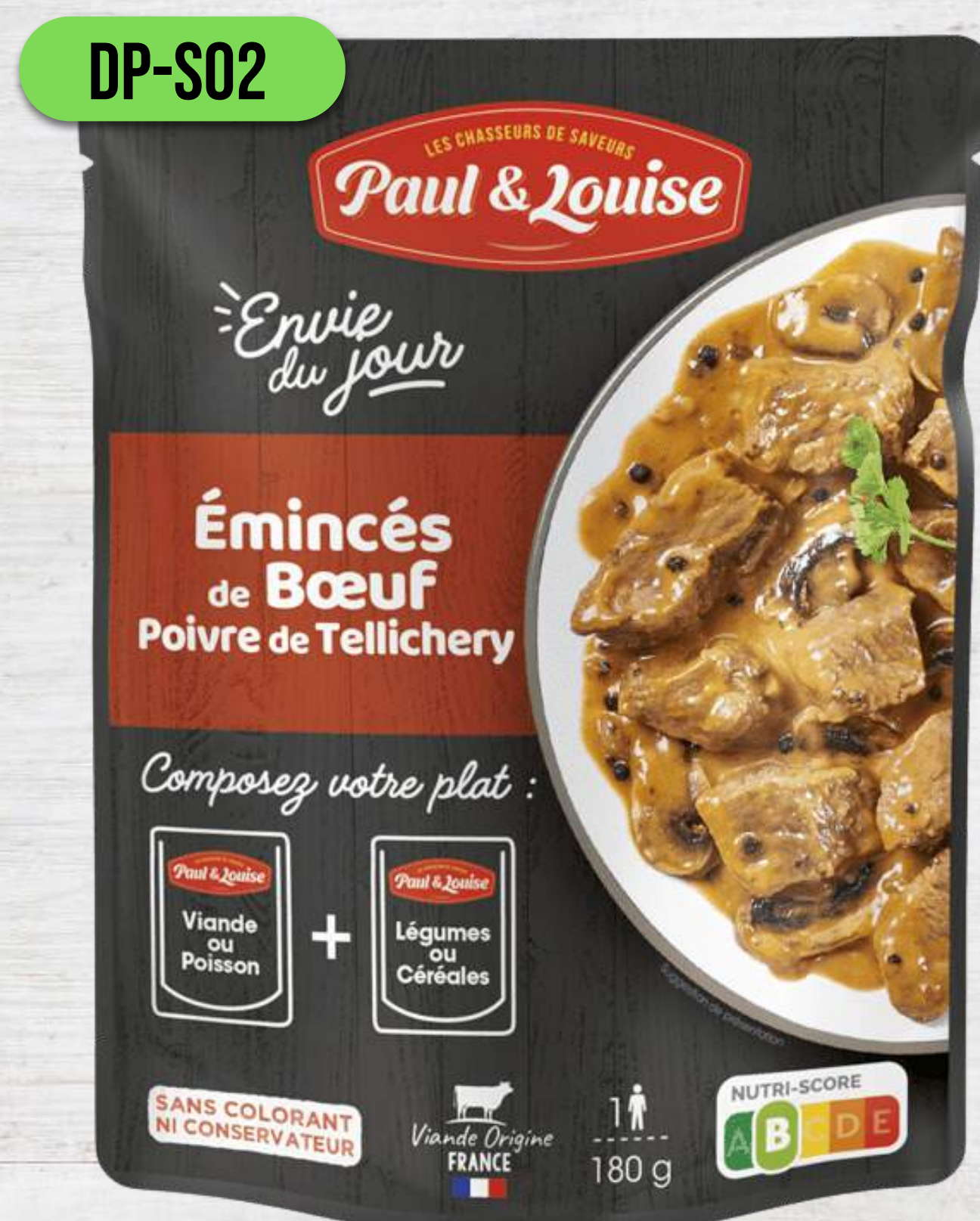
HOVÄDZIE S HUBAMI A ČIERNYM KORENÍM TELlichERY

DOYPACK VRECKÁ 180G + 180G DO MIKROVLNKY AJ DO HRNCA