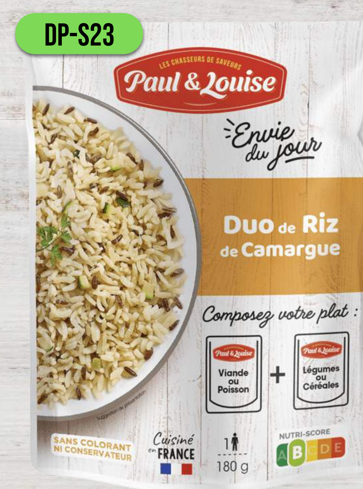
DUO RYŽE Z CAMARGUE