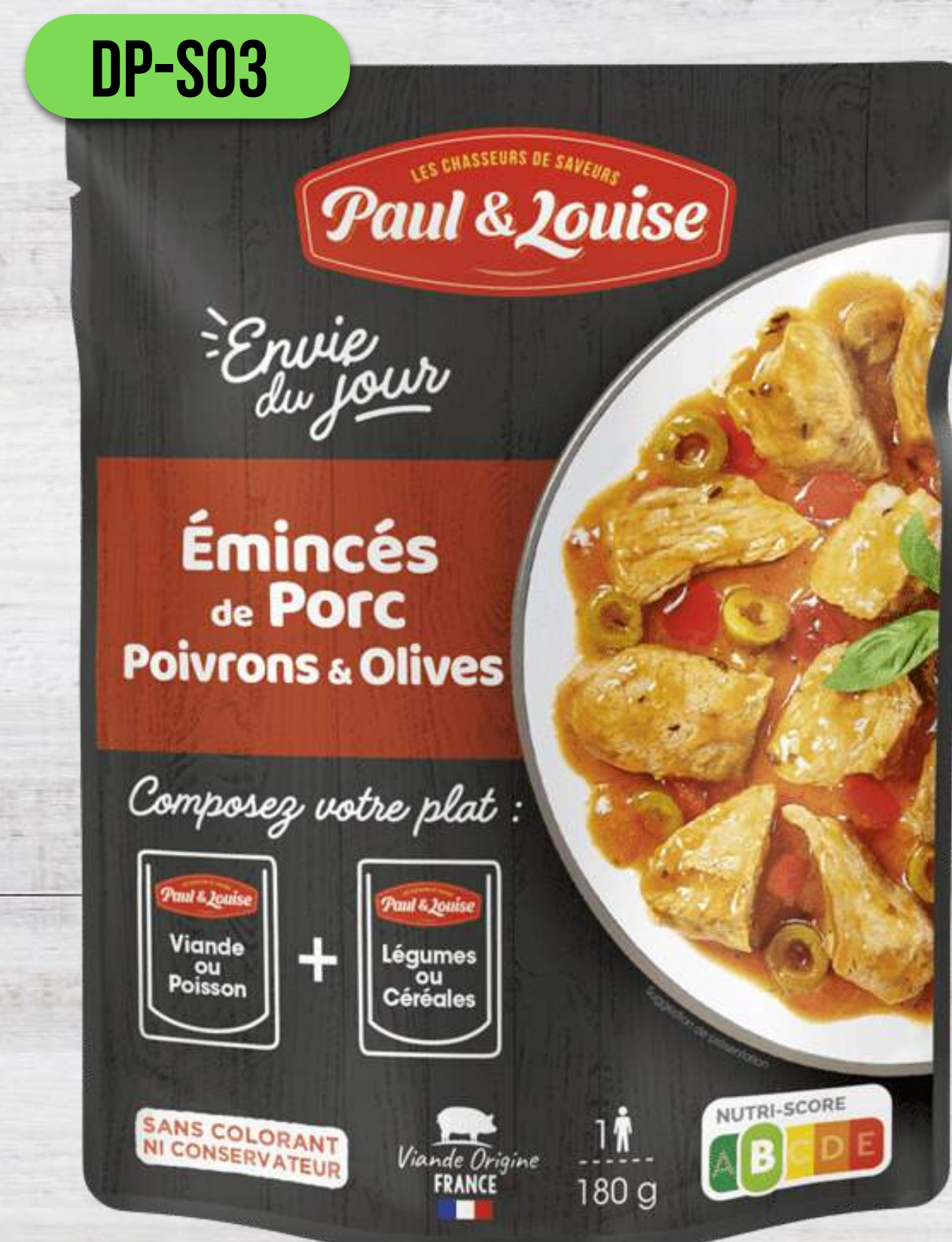
BRÁVČOVÉ S ČIERNYM KORENÍM A OLIVAMI