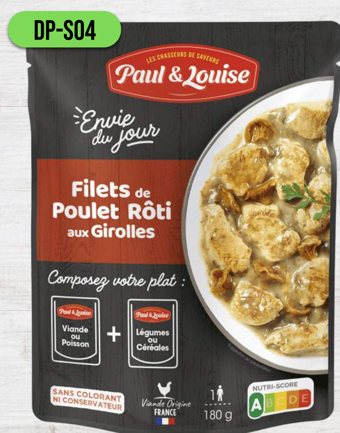
GRILOVANÉ KURACIE FILETY S KURIATKAMI