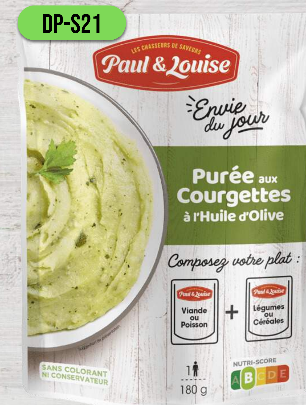
CUKETOVÉ PYRÉ NA OLIVOVOM OLEJI