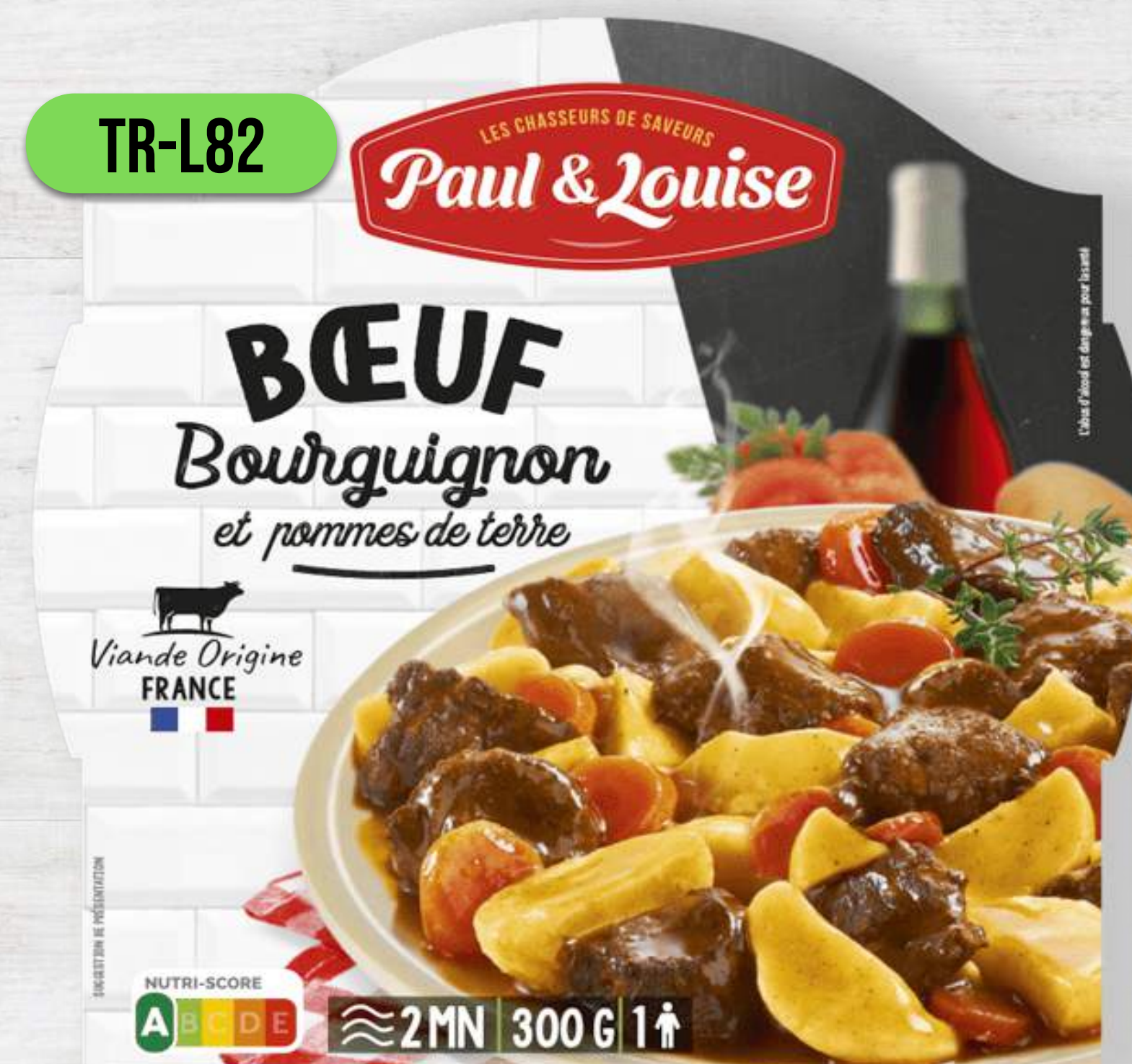
HOVÄDZIE PO BURGUNDSKY SO ZEMIAKMI