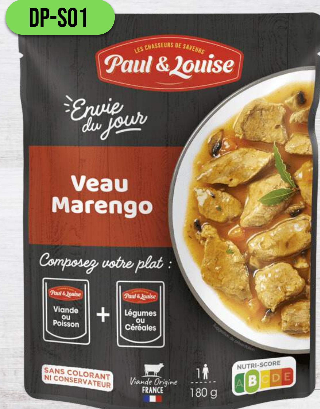
TEĽACIE S HRÍBIKMI A ZELENINOU NA SPÔSOB MARENGO