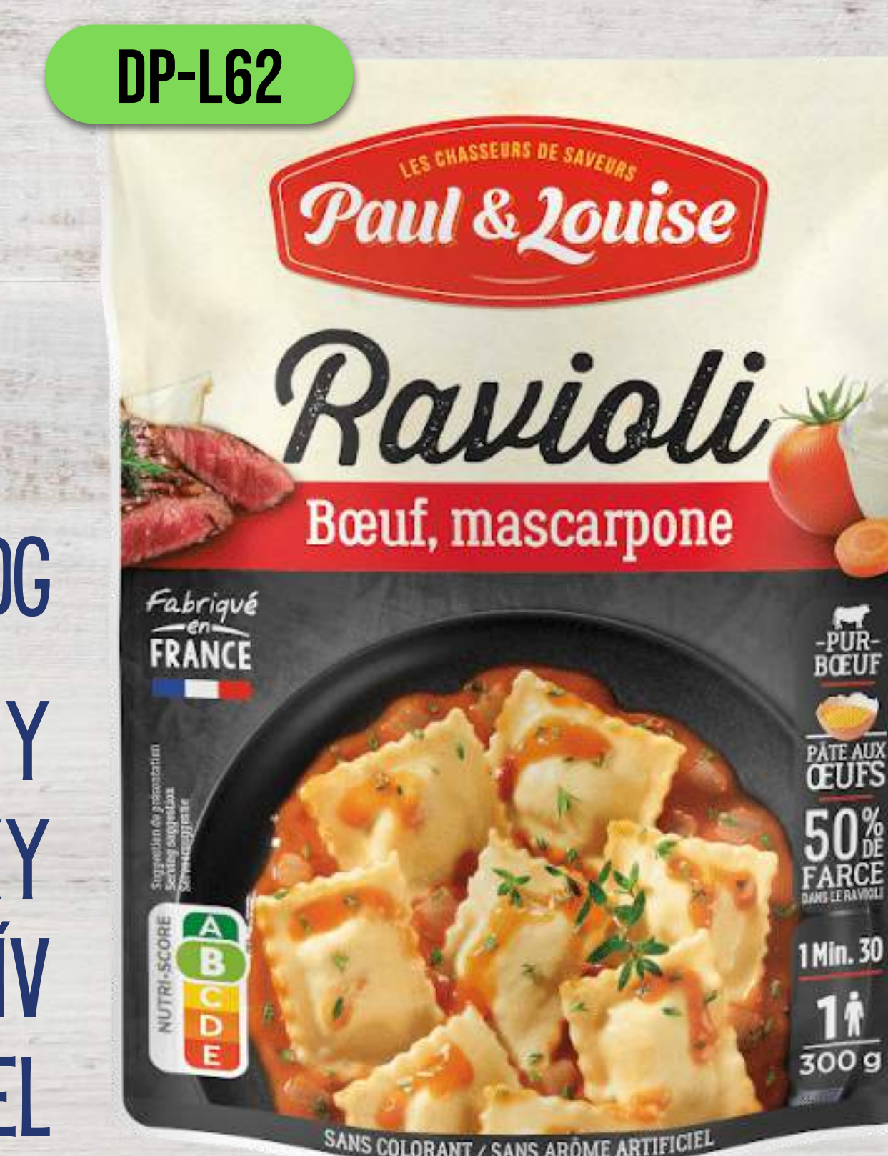
RAVIOLI S HOVÄDZÍM MÄSOM A MASCARPONE

RAVIOLI 300G VAJEČNÉ CESTOVINY 50% PLNKY BEZ FARBÍV BEZ UMELÝCH DOCHUCOVADIEL