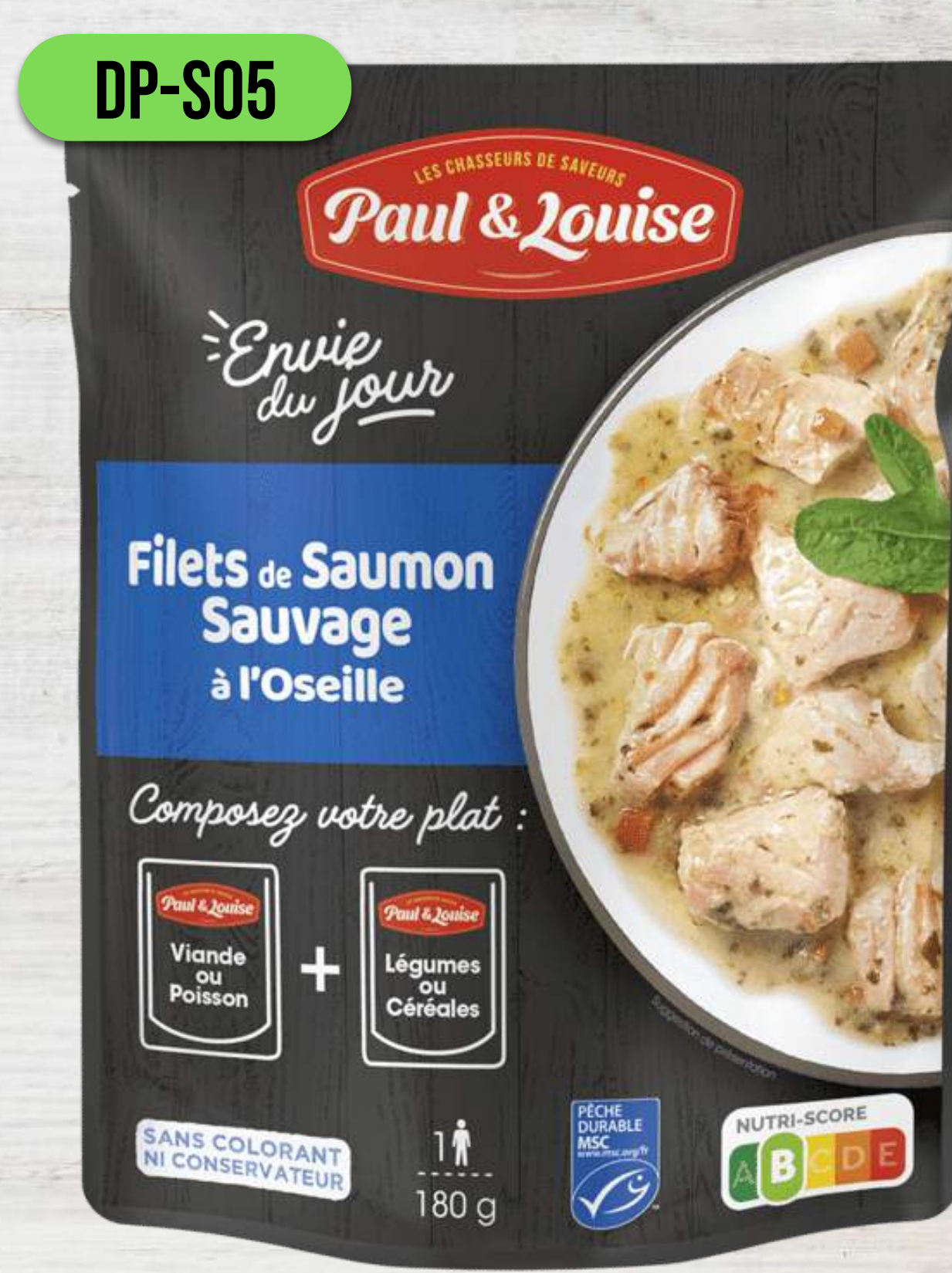
FILET Z DIVOKÉHO LOSOSA SO ŠTAVEĽOM