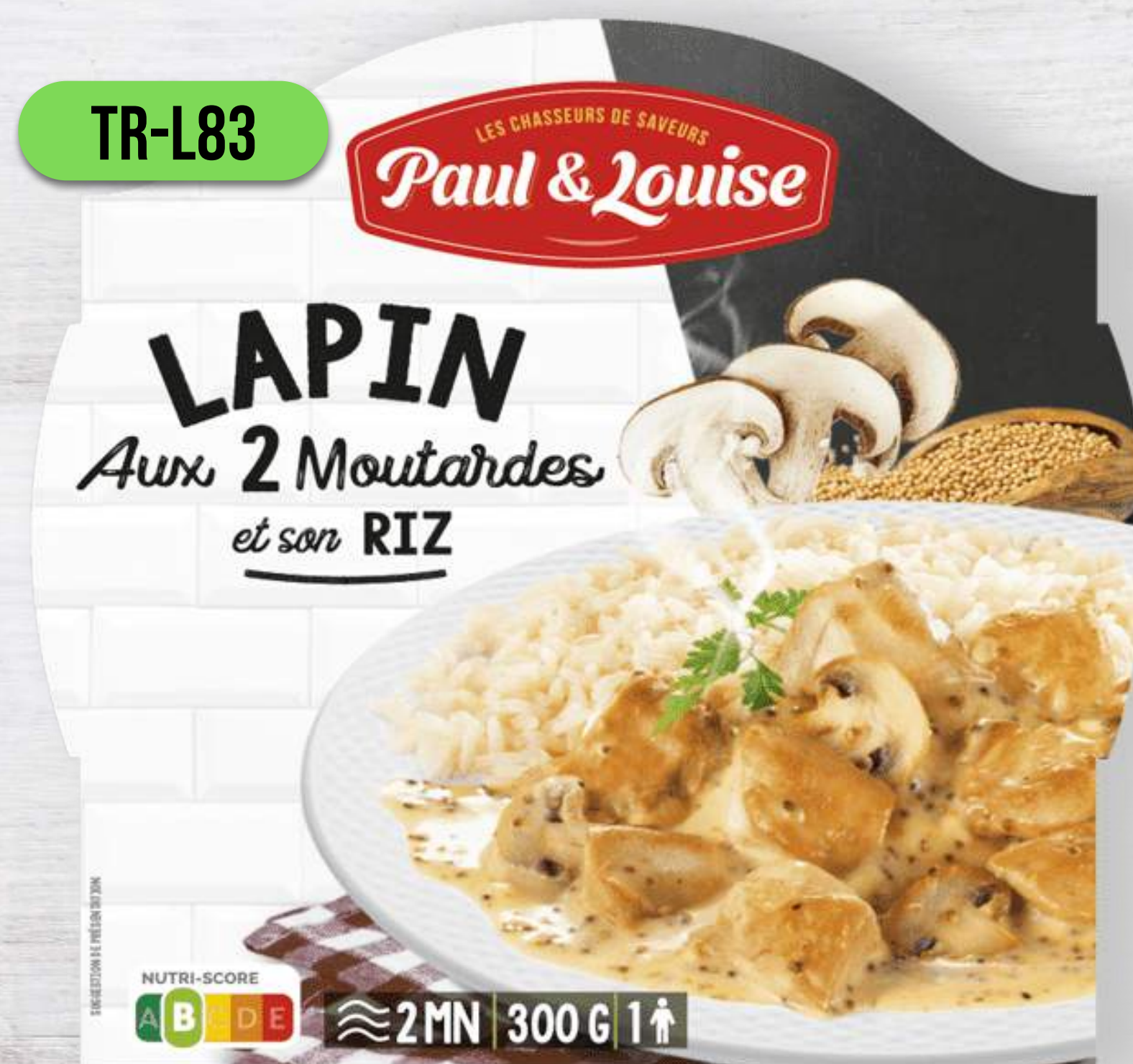
KRÁLIK S HORČICOVOU OMÁČKOU A RYŽOU