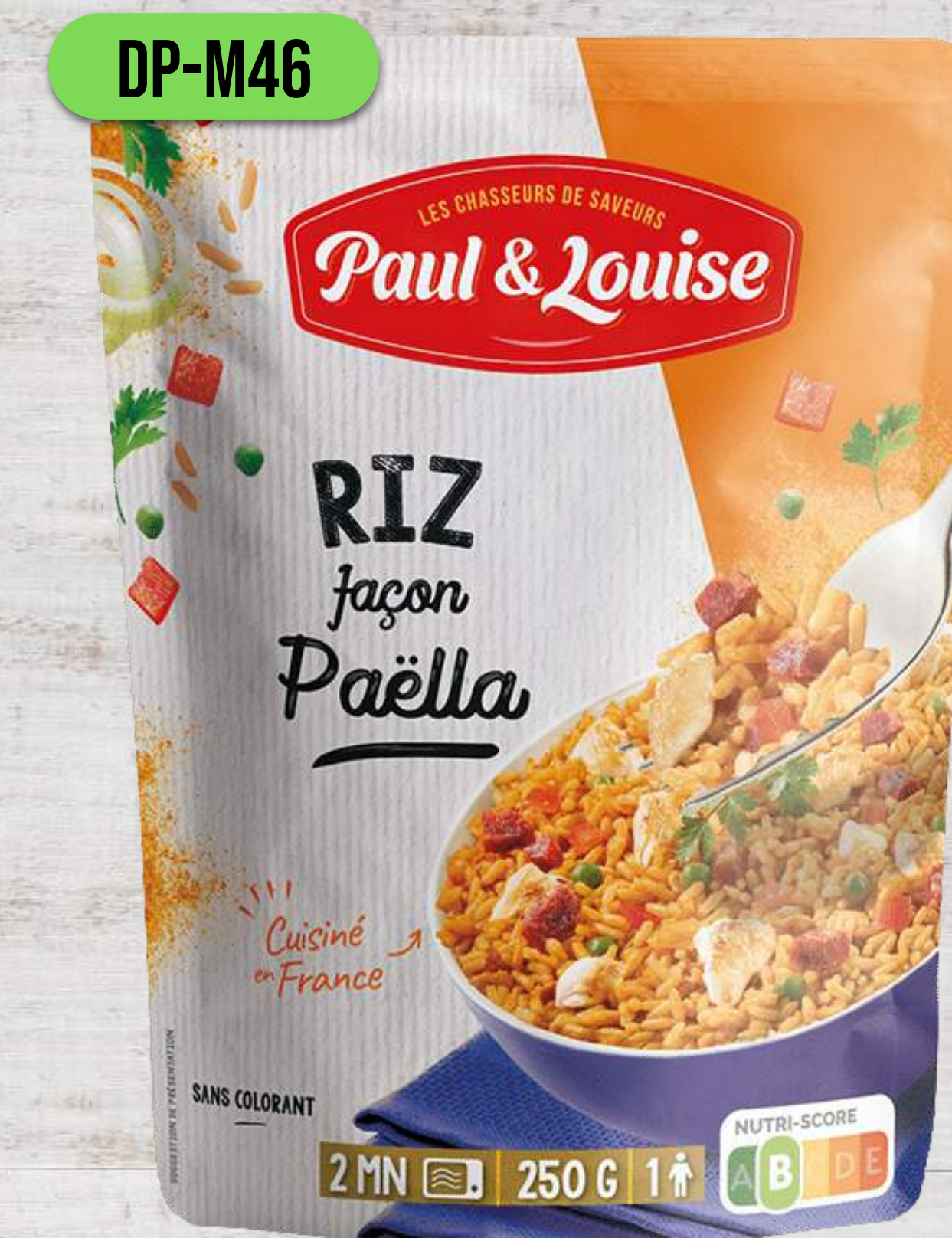
RYŽA V ŠTYLE PAELLA

DOYPACK VRECKÁ 250G A 300G DO MIKROVLNKY AJ DO HRNCA