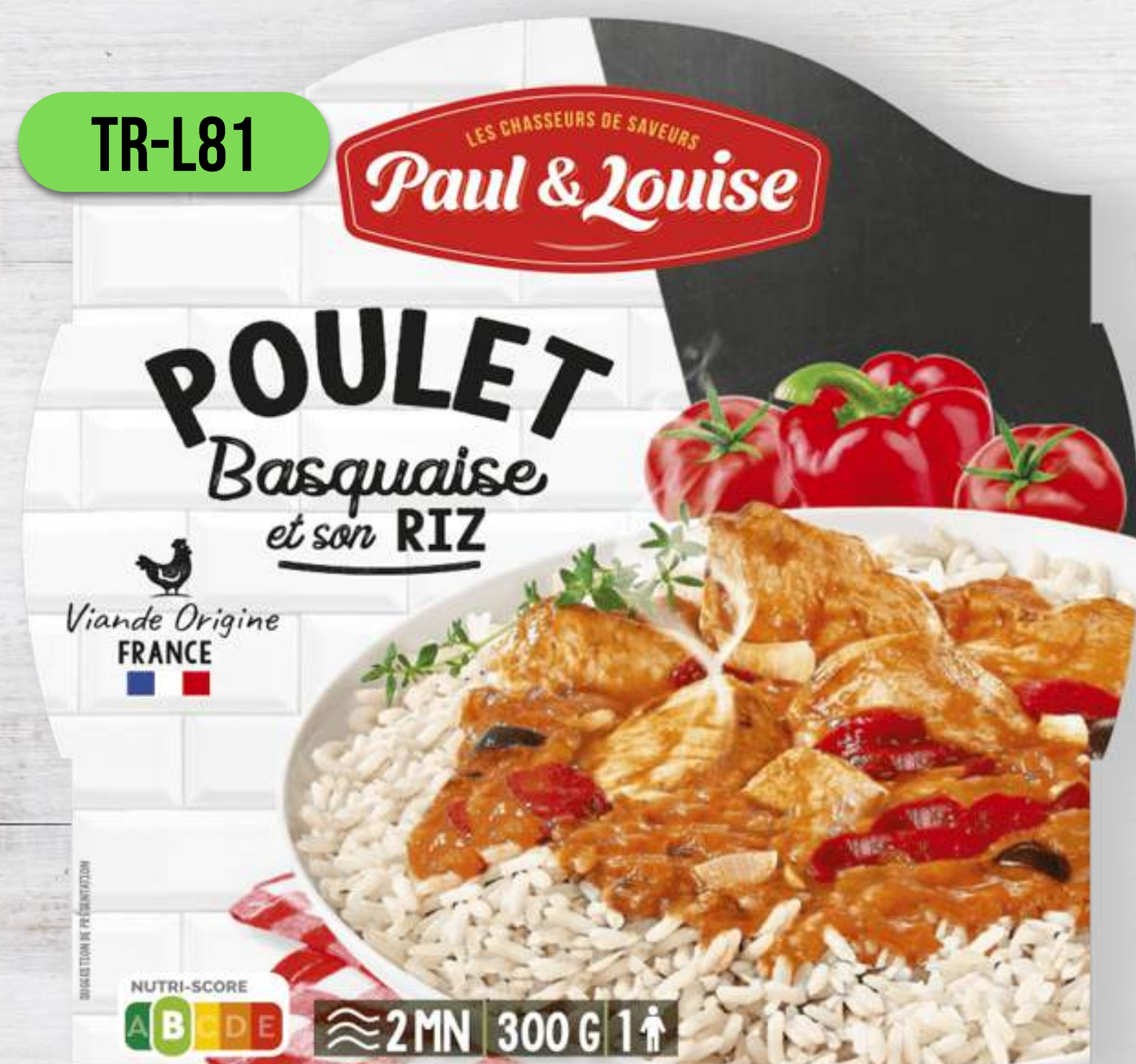
KURA PO BASKICKY S RYŽOU