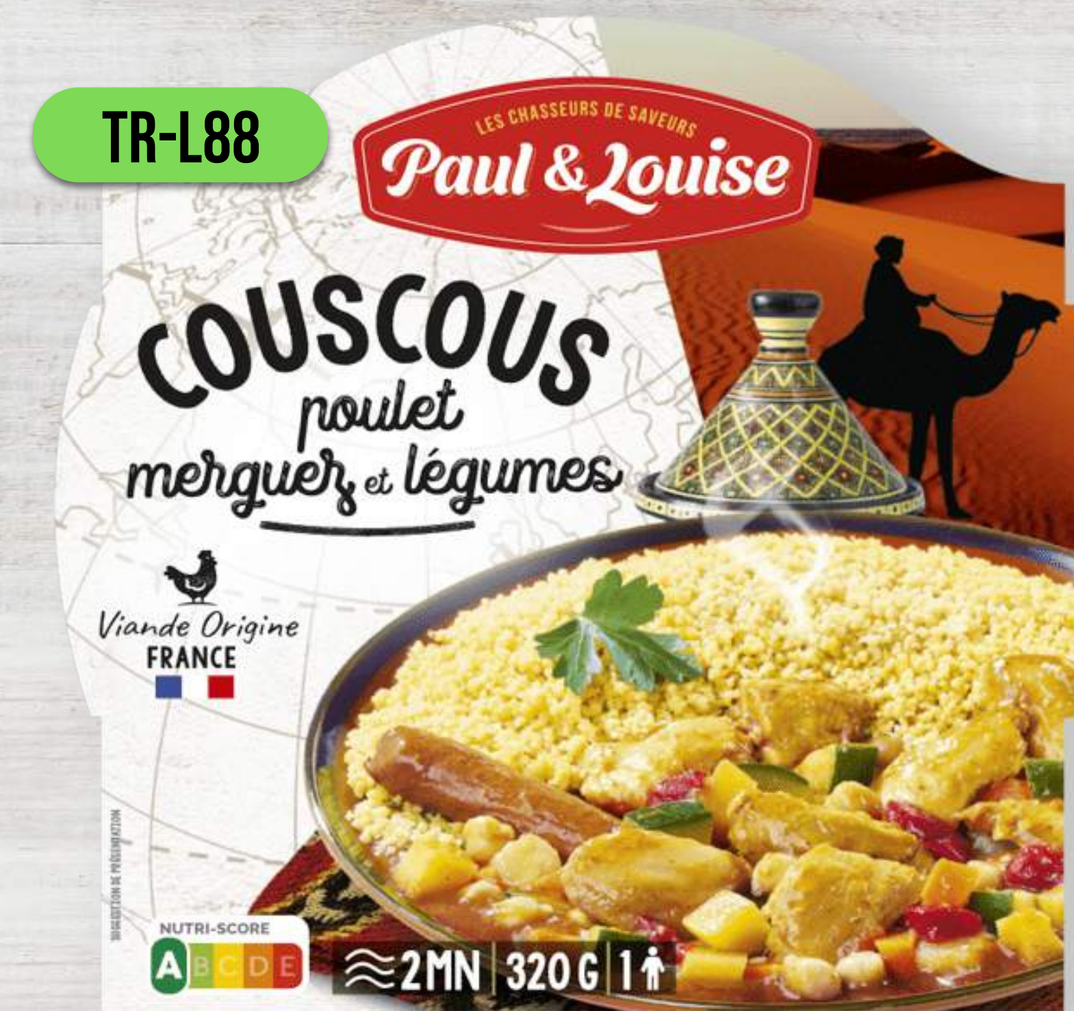
KUSKUS S KURACÍM MÄSOM, PIKANTNOU KLOBÁSOU A ZELENINOU