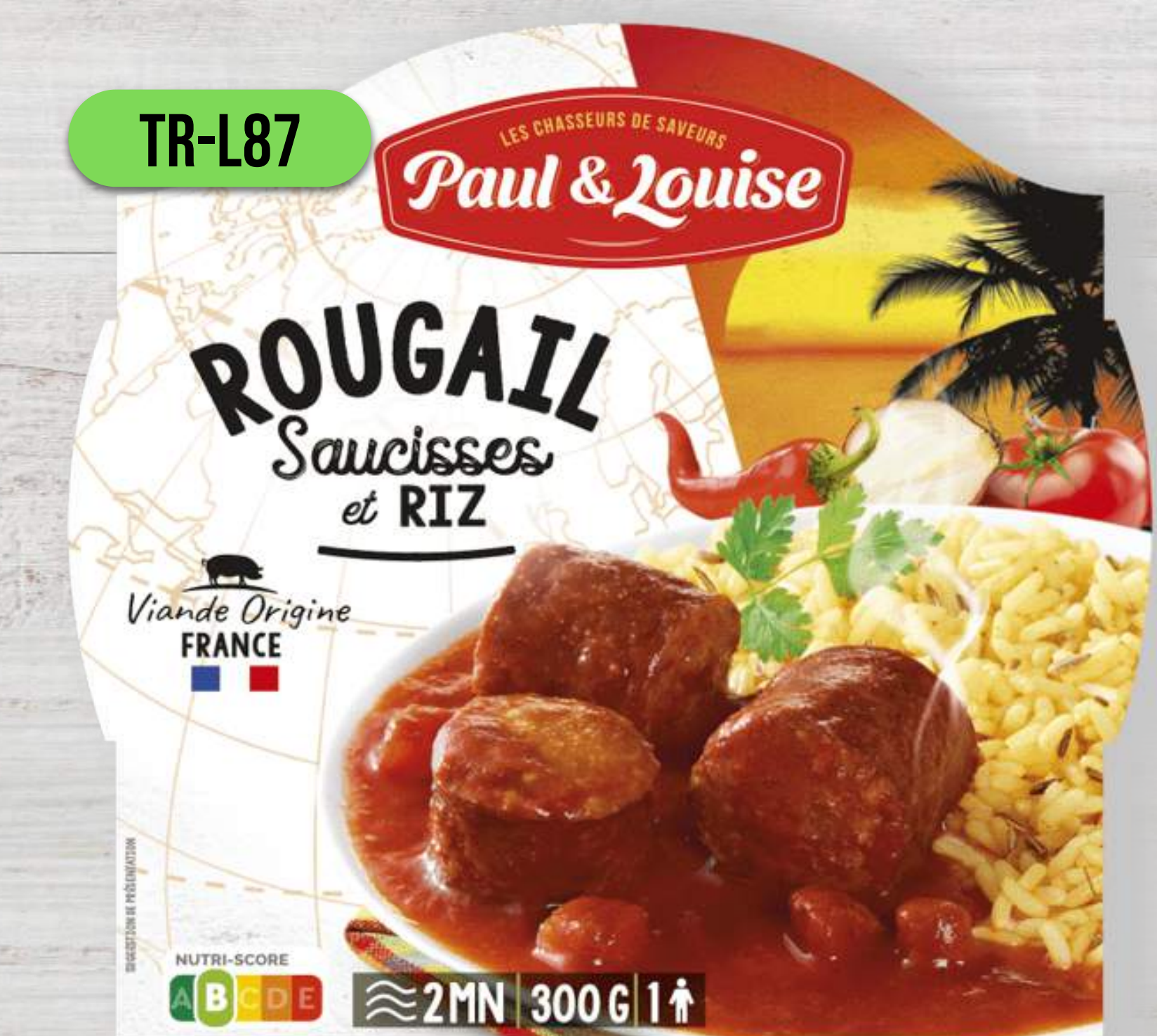
ÚDENÉ KLOBÁŠKY ROUGAIL S RYŽOU