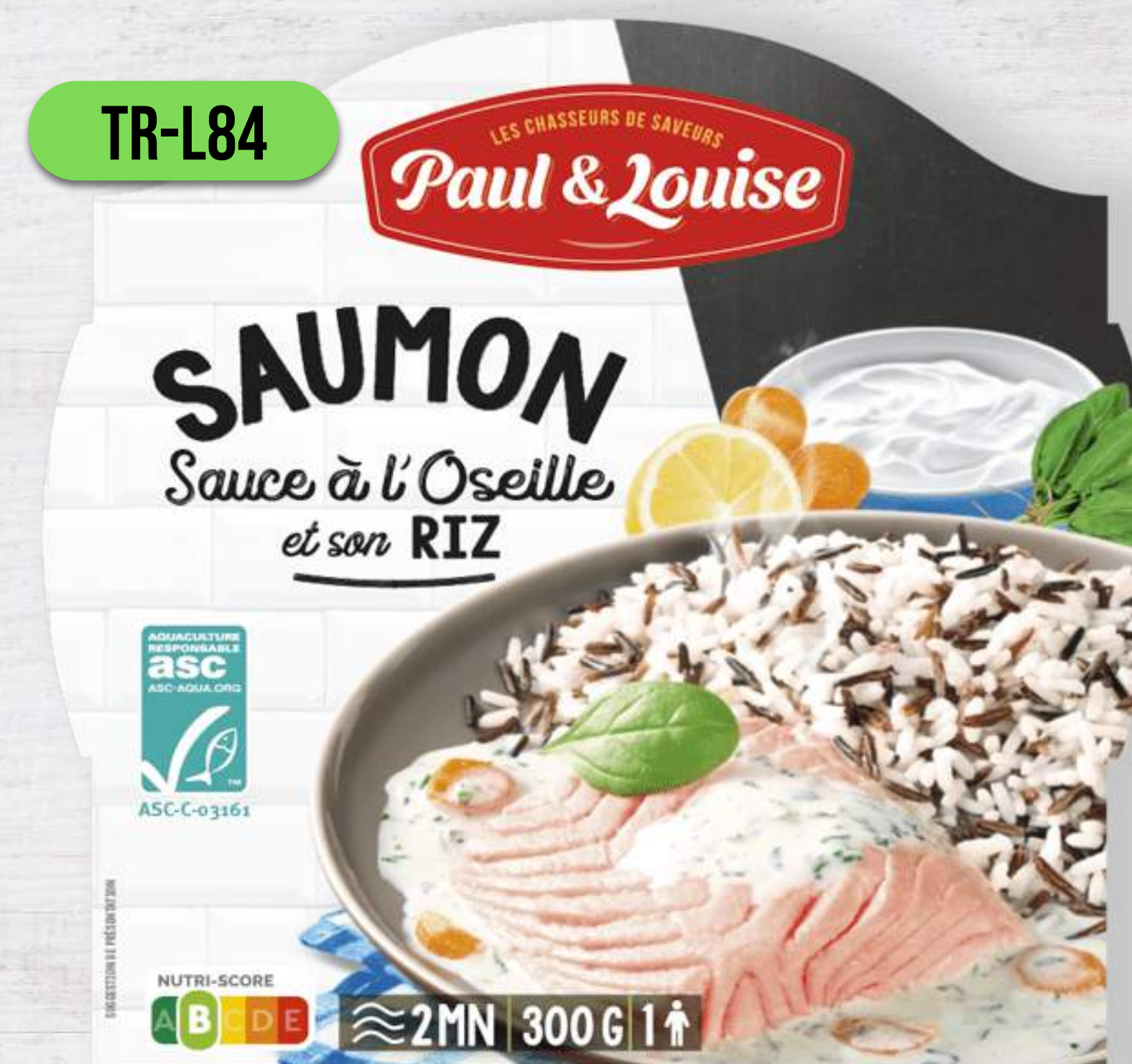
LOSOS SO ŠŤAVELOM A RYŽOU